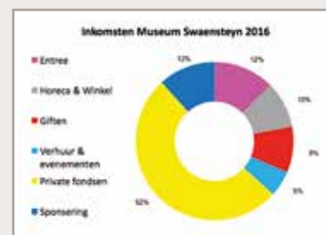
Opbouw eigen inkomsten Museum Swaensteyn.